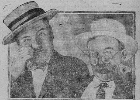
W. C. FIELDS — CHESTER CONKLIN IN "THE CHARLES F. REISNER PRODUCTION "FOOLS FOR LUCK" A PARAMOUNT PICTURE

Para aquellas personas que quieran pasar un rato realmente divertido, para el público ansioso de reir un buen rato vamos a ofrecerles ahora la oportunidad aconsejándoles asistir a la función de hoy a las ocho y media p. m. en el Raventos en la cual se ofrece el estreno de una estupenda farsa cómica de "Paramount" para hacer reir hasta a un inglés.